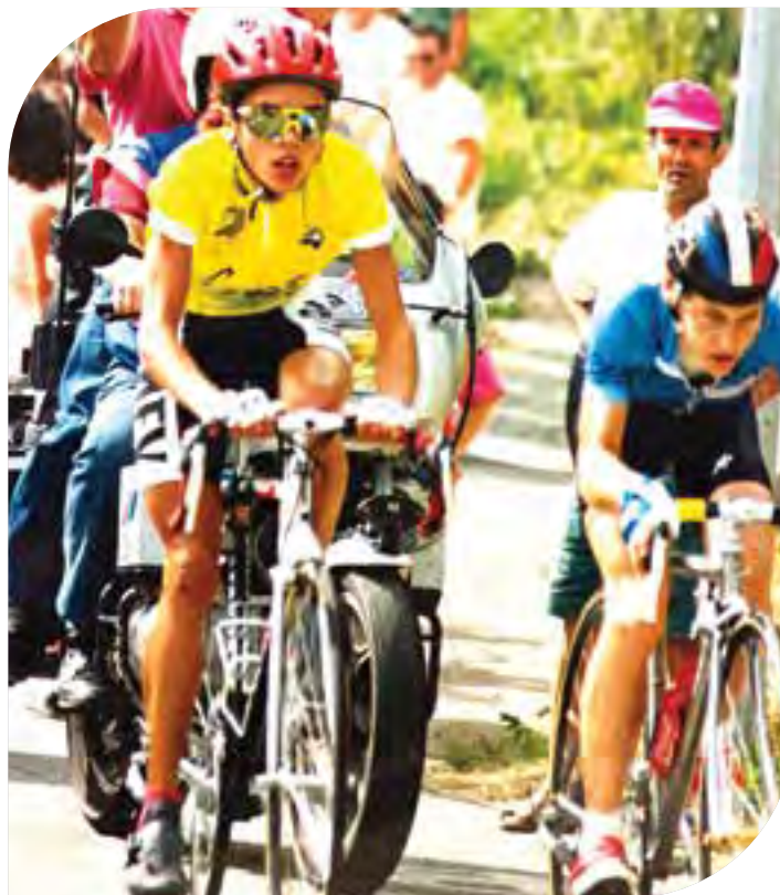
Leontien van Moorsel in duel met Jeannie Longo

Leontien van Moorsel is een van de beste wielrenners ter wereld. Zij werd maar liefst zes keer verkozen tot sportvrouw van het jaar en ook tot beste Nederlandse renner aller tijden. Op haar palmares staan onder andere vier gouden, diverse zilveren en bronzen olympische medailles, negen titels als wereldkampioen en twee eindoverwinningen in de Tour de France. Leontien is nu directeur van de vrouweneditie van de Amstel Gold Race.