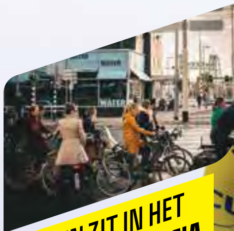
FIETSEN ZIT IN HET NEDERLANDSE DNA