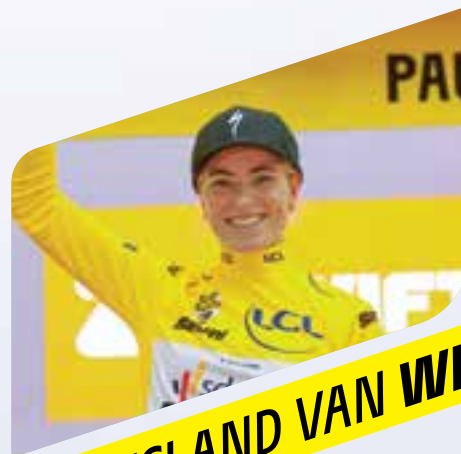
THUISLAND VAN WIELERKAMPIOENEN & TEAMS