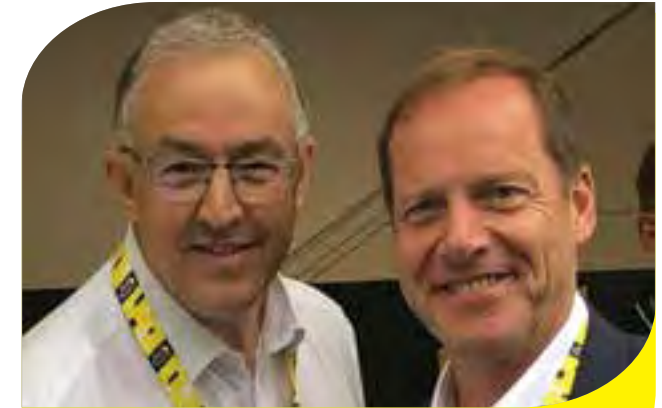
Ahmed Aboutaleb Burgemeester Rotterdam Christian Prudhomme Directeur Tour de France

DE BESTE WIELRENSTERS TER WERELD KOMEN NAAR ROTTERDAM!