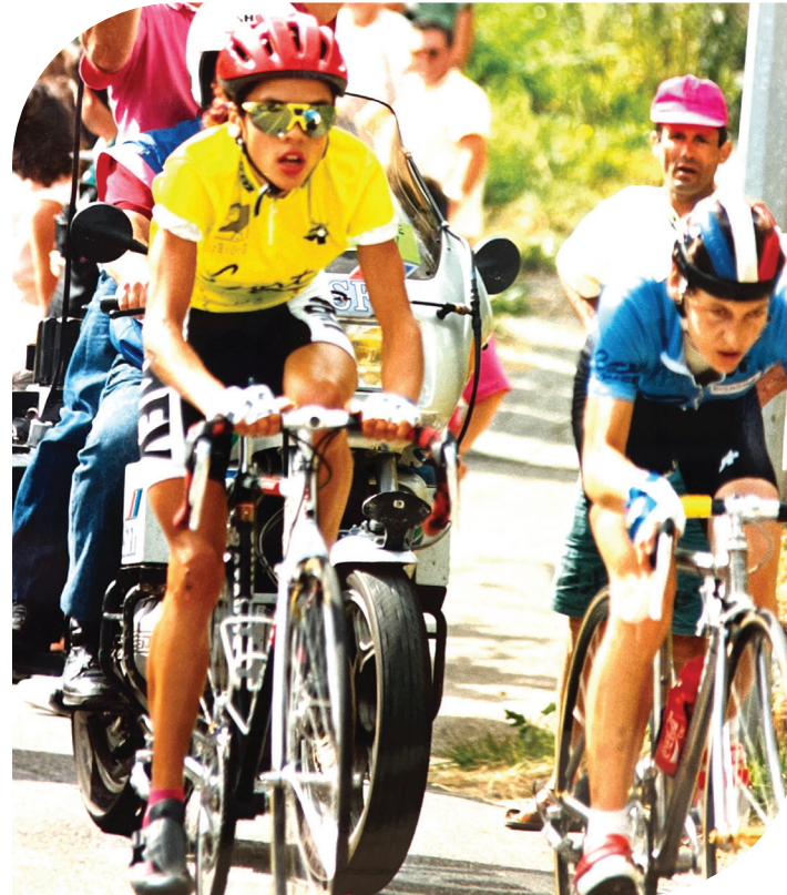
Leontien van Moorsel in duel met Jeannie Longo

Leontien van Moorsel is een van de beste wielrenners ter wereld. Zij werd maar liefst zes keer verkozen tot sportvrouw van het jaar en ook tot beste Nederlandse renner aller tijden. Op haar palmares staan onder andere vier gouden, diverse zilveren en bronzen olympische medailles, negen titels als wereldkampioen en twee eindoverwinningen in de Tour de France. Leontien is nu directeur van de vrouweneditie van de Amstel Gold Race.