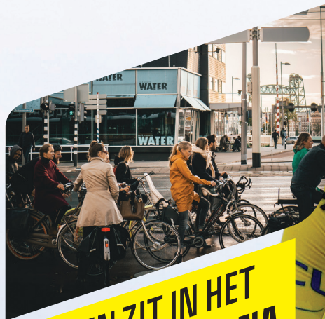
FIETSEN ZIT IN HET NEDERLANDSE DNA