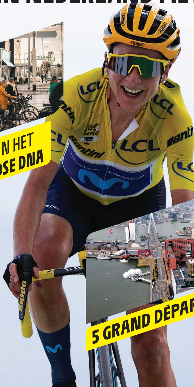
5 GRAND DÉPARTS