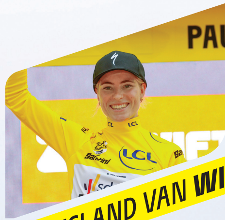
THUISLAND VAN WIELERKAMPIOENEN & TEAMS