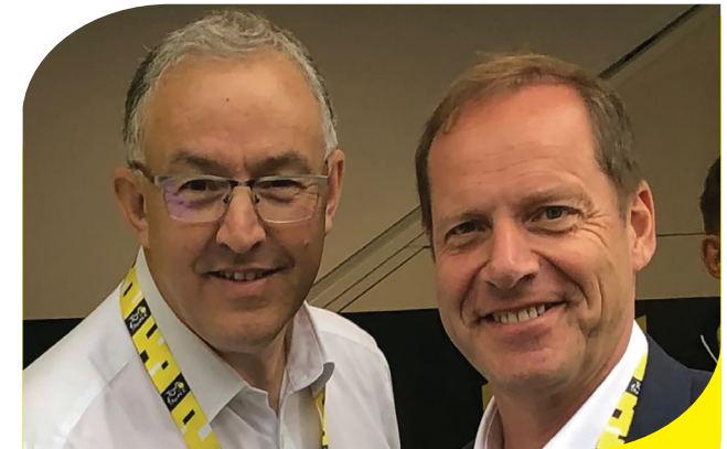
Ahmed Aboutaleb Burgemeester Rotterdam Christian Prudhomme Directeur Tour de France

DE BESTE WIELRENSTERS TER WERELD KOMEN NAAR ROTTERDAM!